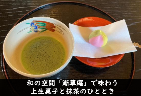
和の空間「漸草庵」で味わう 上生菓子と抹茶のひとつき